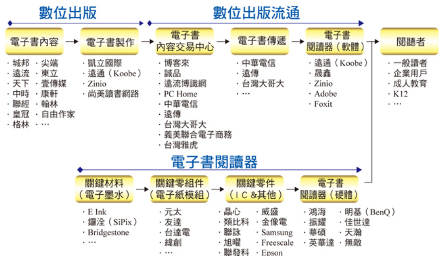
台灣數位出版產業價值鏈

自從Amazon於2007年推出電子書閱讀器「Kindle」締造閱讀市場銷售熱潮，各國紛紛搶搭數位出版及電子書的列車，企圖在全球電子書市場佈局佔有一席之地，我國許多電子大廠諸如明基、鴻海、華碩等亦紛紛投入電子閱讀器製造。但其實電子書產業不只是「電子」與「書」而已，也不只是「閱讀器」的代名詞，電子書其實與數位出版產業息息相關，牽涉到內容即出版業者、製作電子書的軟體商、內容交易中心即交易平台業者、傳遞業者即通信業者、閱讀器軟體業者、閱讀器硬體製造商包括電子墨水、電子紙等材料、零組件、組裝等。各個階段均有可能牽涉到不同的法律層面保護。試說明之。