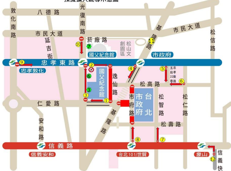
預擬擴大疏導示意圖