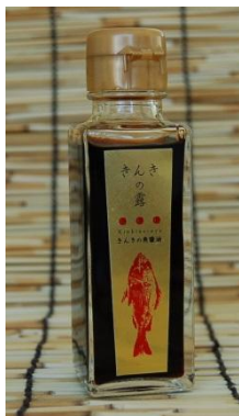
2014年：「魚露」榮獲全國在地味增及醬油評比「最高金獎」四項紀錄。