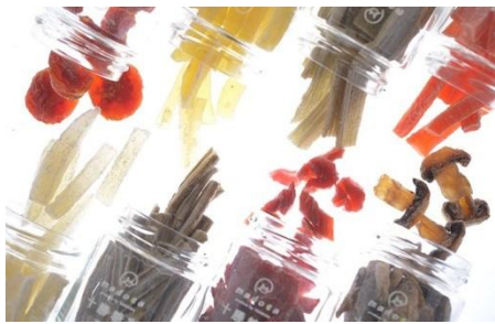
2016年：「十勝糖彩」榮獲「北海道高質食品獎」。

專長： 營運策略、品牌設計、 商品企劃、店面經營、 顧客關係管理、顧客 滿意度、網站經營。