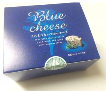
2012年：「黑松內Blue Cheese」榮獲「ALL JAPAN Natural Cheese競賽」金獎。