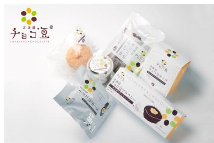
2012年：「北海道巧克力豆」榮獲「北海道新技術・新產品研發獎食品組」特別獎。