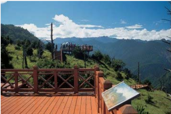
【雪霸國家公園管理處】與

【中華綠生活休閒發展協會】今年 5 月 17 日起在觀霧、白蘭地區合辦 2 梯次的「與國家公園有約-白蘭部落～與螢共舞.古道探秘」生態旅遊活動。行程中走訪觀霧雪霧步道、觀霧山椒魚生態中心，了解稀有新寵兒-山椒魚生態、清泉部落深度人文探秘、體驗白蘭部落泰雅文化山林活動、大隘部落-石頭生態園區、夜間賞螢火蟲生態活動……。活動日期均在星期例假日，包括：5 月 17、18 日；5 月 24、25 日二梯次，每梯次 20 人名額有限，有興趣參加活動的民眾，可向【中華綠生活休閒發展協會】報名。