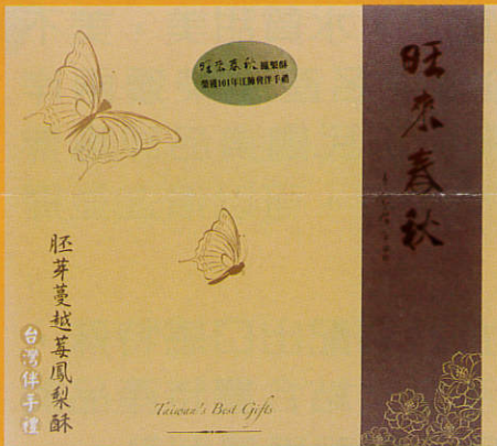
胚芽蔓越莓 NT420 10入/盒