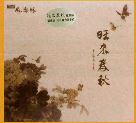
頂級鳳梨酥 NT350 10入/盒