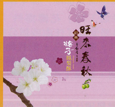
紹興梅子鳳梨酥 NT380 10入/盒