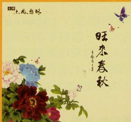
金鑽土鳳梨酥 NT380 10入/盒