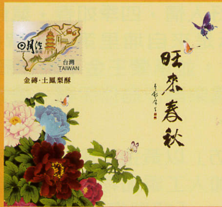
金磚土鳳梨酥 NT450 10入/盒