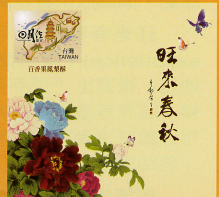
百香果鳳梨酥 NT380 10入/盒